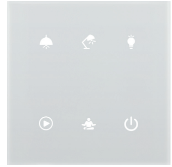
Obrázek je ilustrativní, ikony (symboly) jsou konfigurovatelné zákazníkem