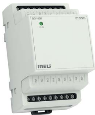
Código EAN IM3-140M: 8595188132459